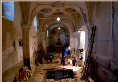
Pohľad do interiéru kostola počas výskumu.