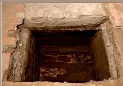
Hroby objavené pri západnej stene stredovekej lode kostola.