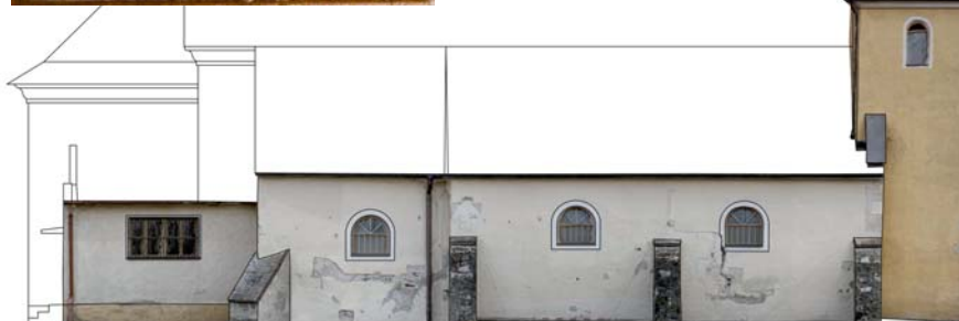
Fotogrametria „starej“ časti kostola (13. – 17. stor.)