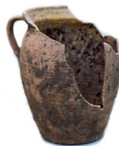
Nádoba objavená pod podlahami pri južnej stene lode kostola.