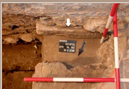
Zvyšky kamenného prahu pôvodného portálu a stredovekej podlahy odkryté v južnej stene lode.