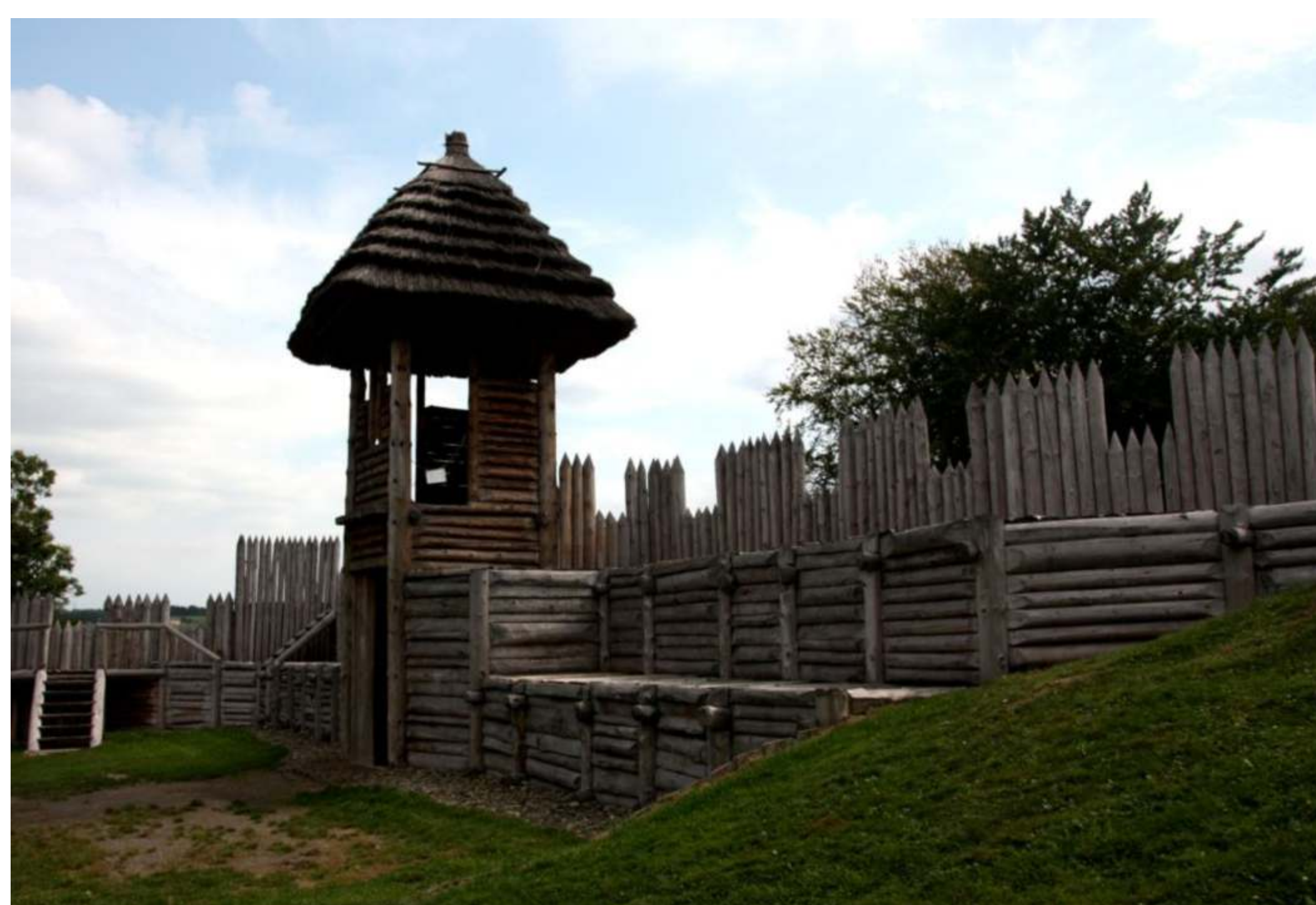
Chotěbuz (České Sliezsko), prezentácia veľkomoravského hradiska