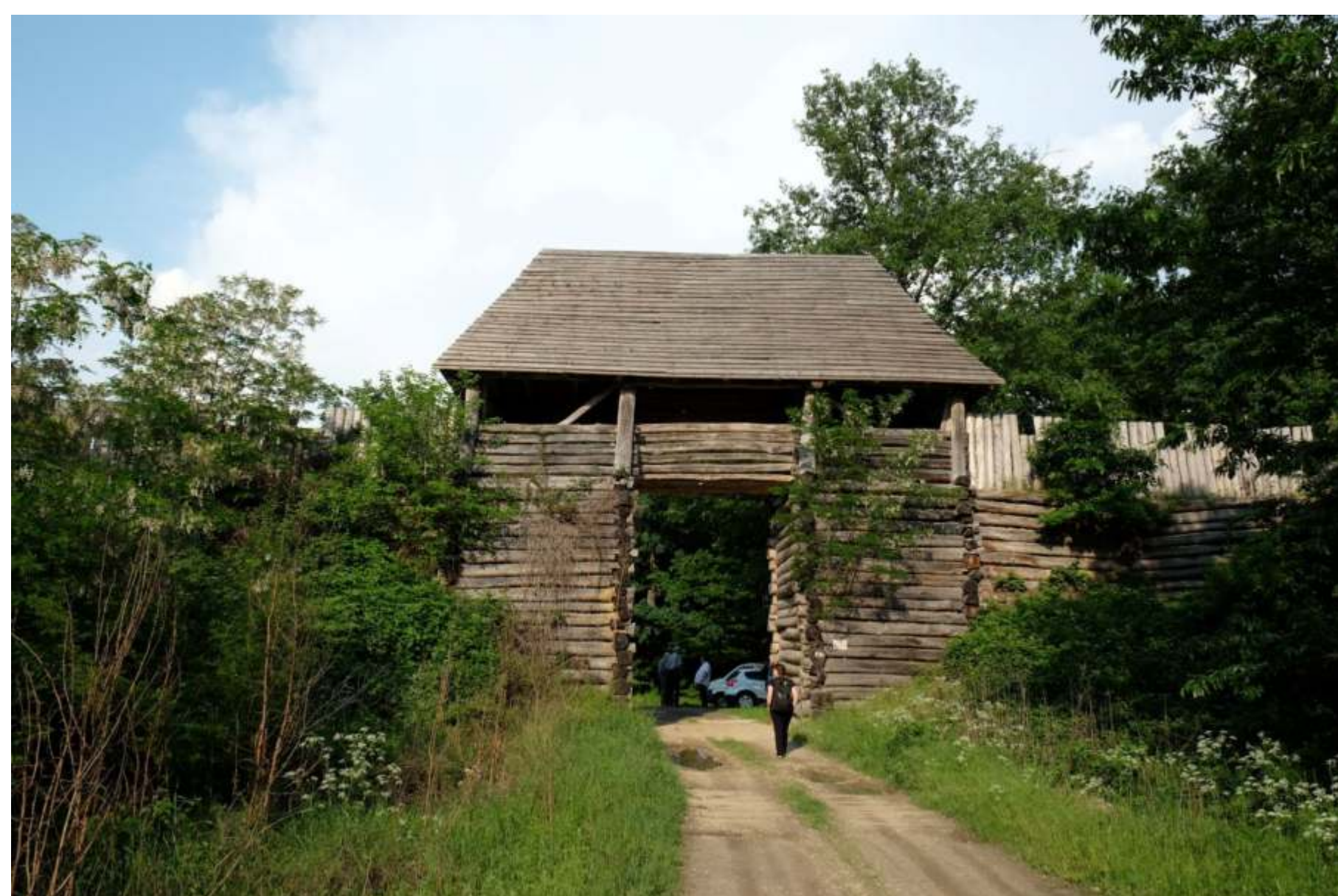
Vasvár (Maďarsko). Brána stredovekého opevnenia

Východná brána hradiska Valy patrí k najväčším architektúram svojho druhu v slovanskom svete. Jej pamiatkovú obnovu umožnilo dobré zachovanie pôvodnej drevenej konštrukcie vchodu a jeho nadstavby. Rekonštrukcia je výsledkom spolupráce archeológov, pamiatkárov, architektov, statikov a odborníkov na dávnoveké vojenstvo. Symbolizuje vynikajúce stavebné umenie našich predkov ako súčasť prezentácie a popularizácie národnej kultúrnej pamiatky. Realizáciu diela umožnil projekt Ministerstva kultúry SR a Obce Bojná, za odbornej spolupráce Archeologického ústavu SAV.