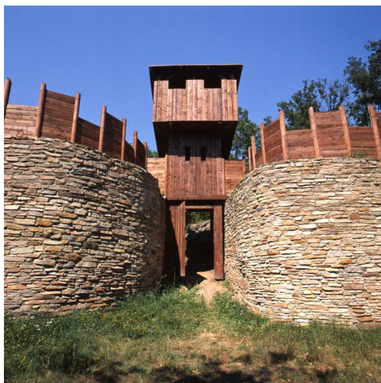
Gars am Kamp (Dolné Rakúsko). Brána veľkomoravského hradiska