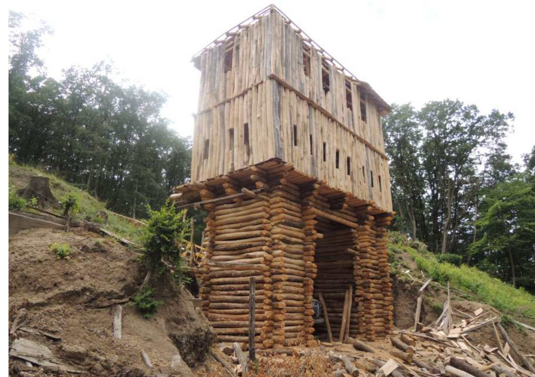
Bojná. Rekonštrukcia východnej brány