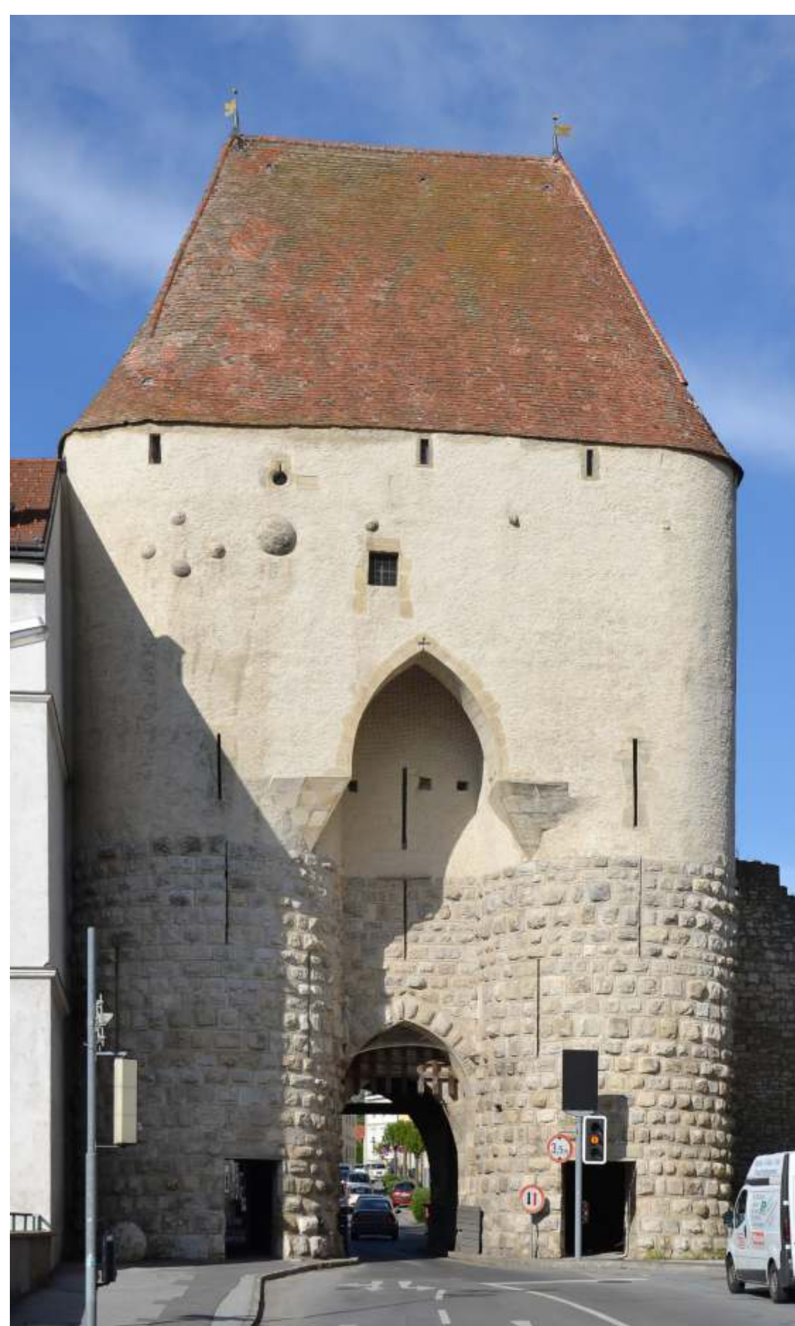
Hainburg an der Donau (Rakúsko).