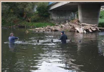
Dokumentácia ľadolamu