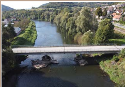
Pohľad na most a brod