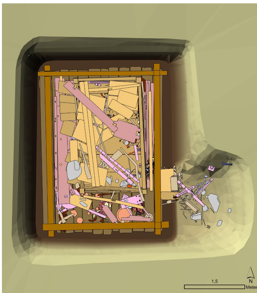
Poprad-Matejovce – plán hrobky zobrazujúci rozloženie nálezov (ZBSA, Schleswig).