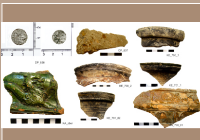
Hrad Lietava, sonda 53B/2023. Nález striebornej mince z povrchového zberu. Keramické nálezy z sondy 55.