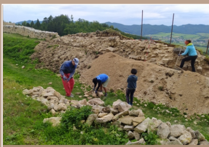
Hrad Lietava, sonda 53B/2023. Pracovný záber. Začistovanie vnútornej strany pravouhého bastiónu