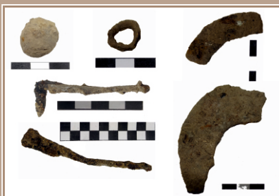
Hrad Hrušov, sonda 13D/2024 výber drobných predmetov z novoveku 17.-18.storočia