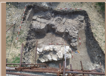
Hrad Hrušov, sonda 13D/2024, pohľad zo severu, zachytený druhý pilier mosta a skalné podložie