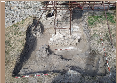
Hrad Hrušov, sonda 13D/2024, pohľad z juhu na druhý pilier mosta a skalné podložie