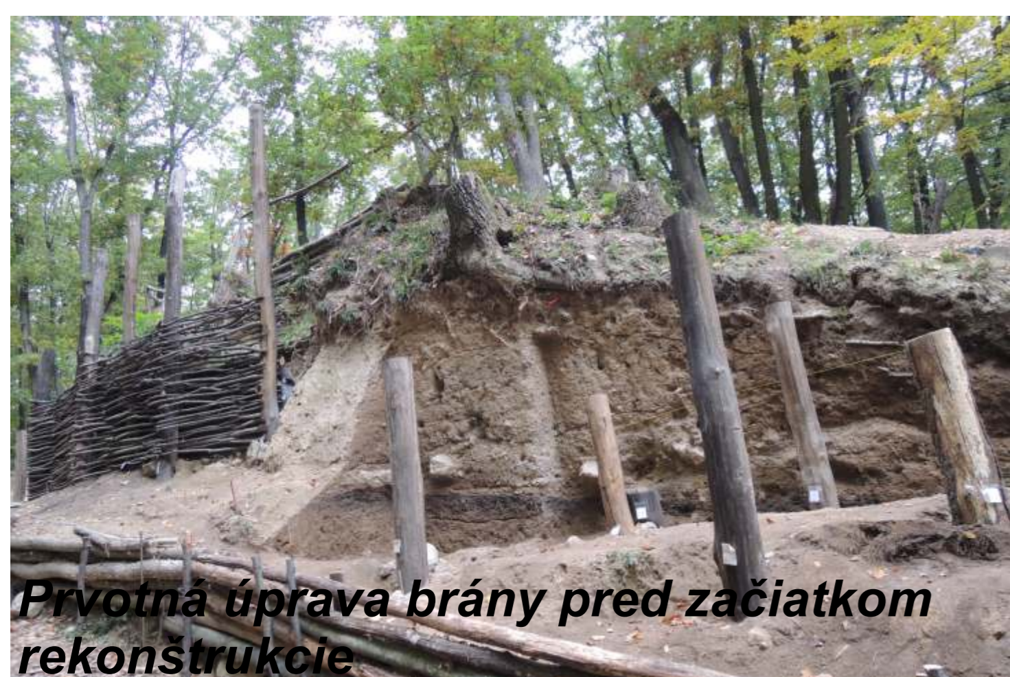
Prvotná úprava brány pred začiatkom rekonštrukcie