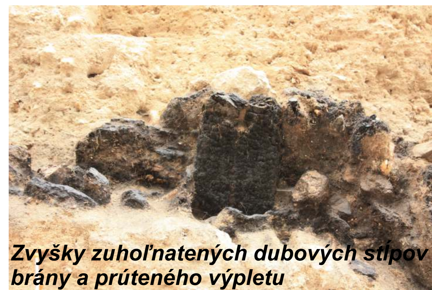
Zvyšky zuhoľnatených dubových stĺpov brány a prúteného výpletu