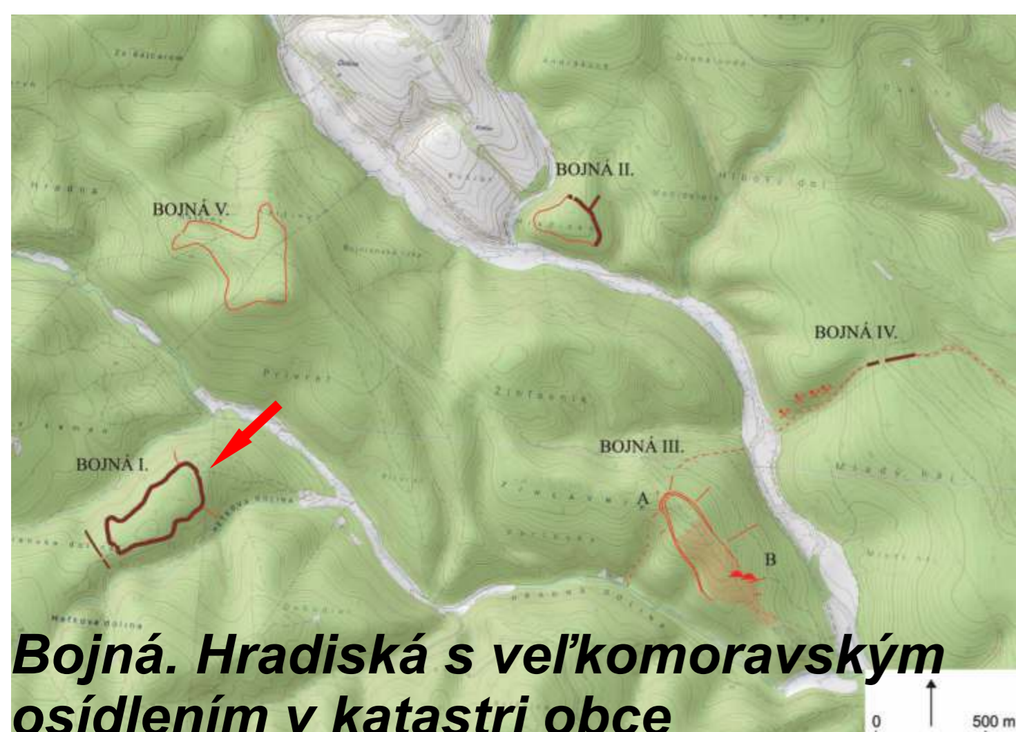
Bojná. Hradiská s veľkomoravským osídlením v katastri obce