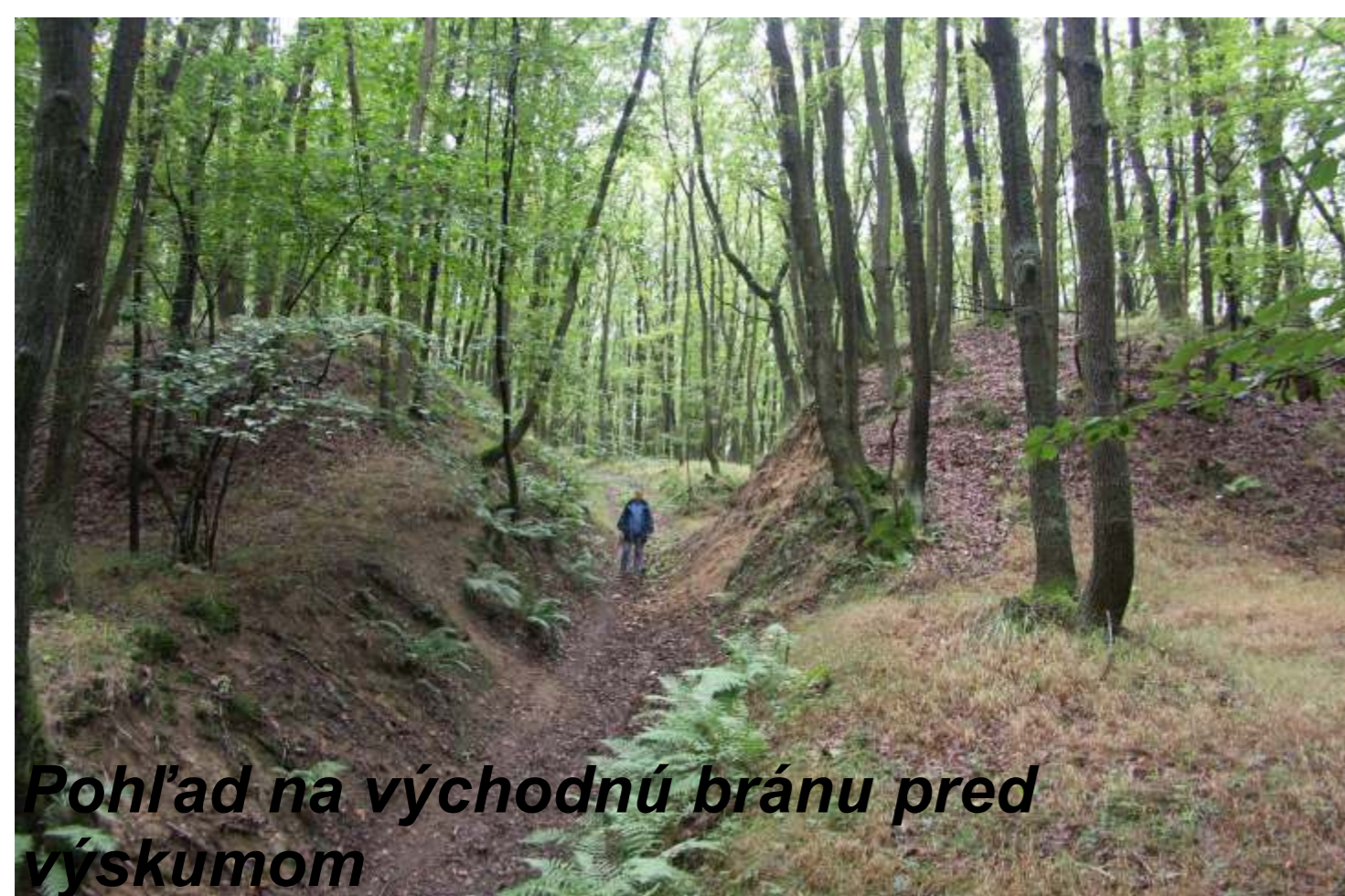
Pohľad na východnú bránu pred výskumom

Podľa dendrochronologických dát a analýz C14 val vznikol koncom vlády Svätopluka po roku 890 a najmladšia stavebná aktivita spadá do doby okolo roku 908. Na budovanie tejto mohutnej hradby včítane brán staviteľia použili aj základy staršej fortifikácie i sídliskový odpad z vnútornej zástavby. Na začiatku 10. storočia bolo hradisko dobyté, zničené požiarom a následne opustené. Preto sa pre našu históriu zachovalo vo vzácné ucelenej a neporušenej podobe.