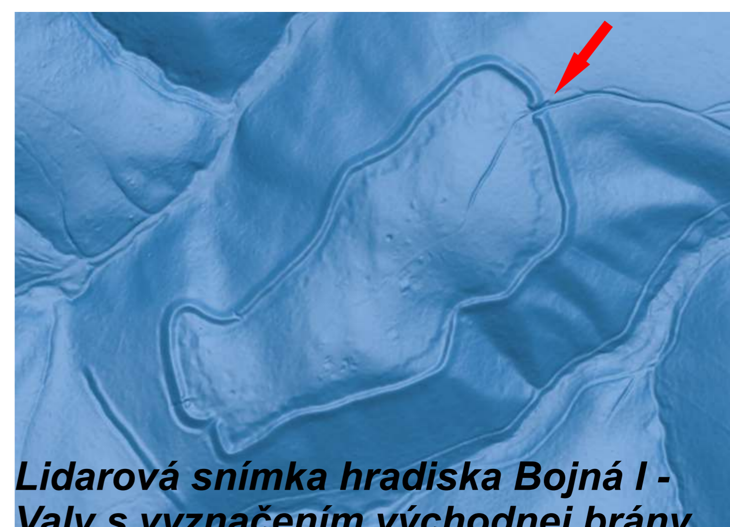
Lidarová snímka hradiska Bojná I - Valy s vyznačením východnej brány