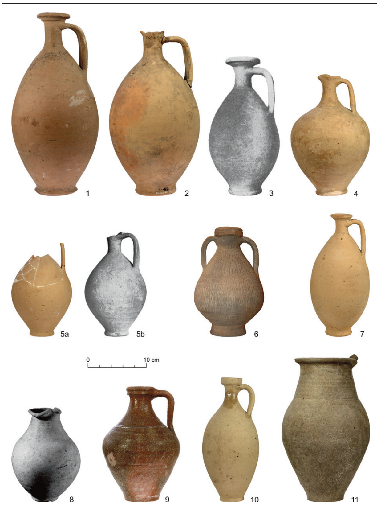
Obr. 2. Rímsko-provinciálne keramické nádoby v hrobch z obdobia avarského kaganátu na Slovensku. 1–6 – Bratislava-Devínska Nová Ves I (1 – hrob 77; 2 – hrob 100; 3 – hrob 228; 4 – hrob 709; 5a, 5b – hrob 302A; 6 – hrob 401); 7 – Čataj I, hrob 251; 8 – Holiare, hrob 71; 9 – Nové Zámky I, hrob 224; 10 – Obid I, hrob 70; 11 – Radvaň nad Dunajom-Žitava I, hrob XLI (3; 5b – podľa Eisner 1952, obr. 77: 1; 78: 3; 8 – podľa Točík 1968, tab. XXXIII: 16; ostatné – foto P. Červeň).