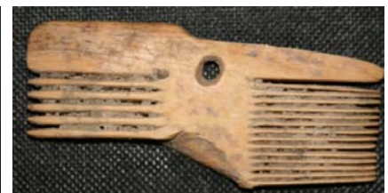
Neskorenesančná kachlica z 2 polovice 16. storočia a zlomok kosteného hrebeňa