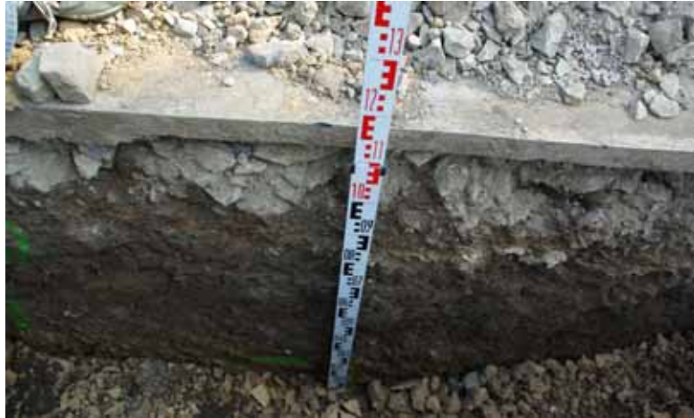
Obr. 01. Zvolen, Bánika 43. Pohľad na profil s kultúrnou vrstvou.