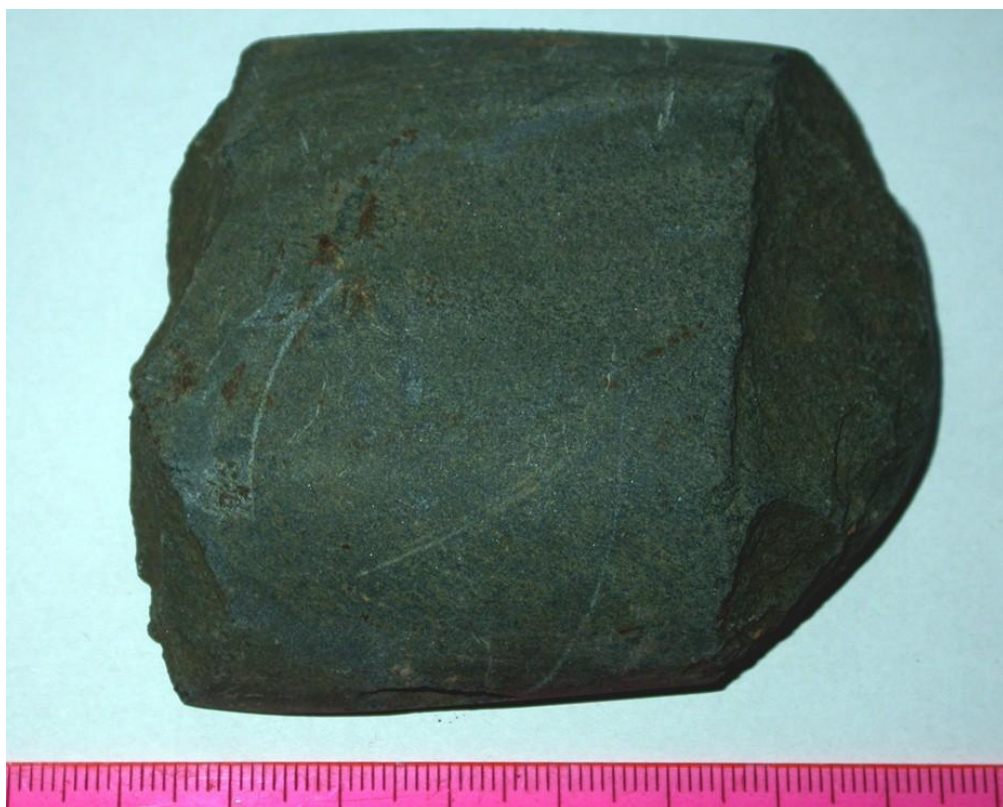
Obr. 2. Neúplná kamenná sekera z polohy Vrátá z Malých Ripnian (4000 r. pred Kr.).