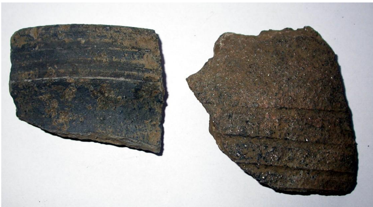
Obr. 3. Fragментy stredovekých nádob z Čermán (14.-15. stor.).