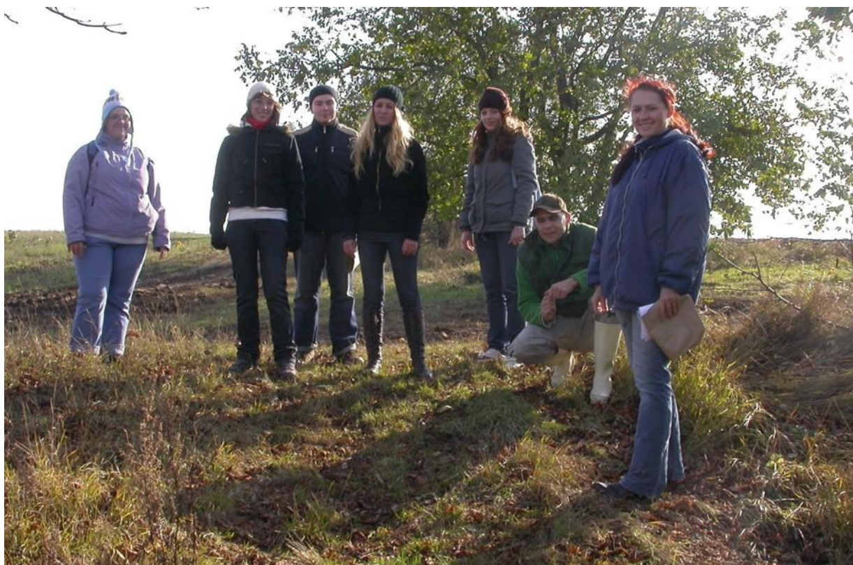
Obr. 4. Účastníci archeologického prieskumu.