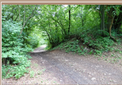
Pohľad na dnešný vstup do hrádka poľnou cestou, ktorá vedie priestorom predpokladanej pôvodnej brány. V profile terénu vpravo od cesty viditeľná kamenná deštrukcia.