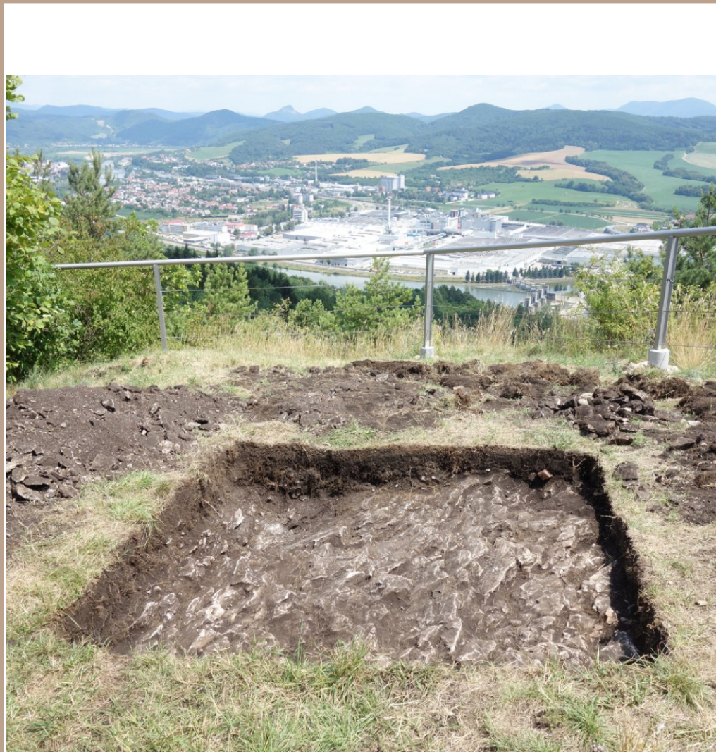
Streženice, Skala. Sonda I, skalné podložie po odstránení kultúrnej vrstvy, a pohľad z hrádka na severovýchod na údolie Váhu a južný okraj Púchova (foto: L. Benediková).