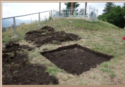
Sonda I pri závere križovej cesty. Kultúrna vrstva a v južnom rohu vystupujúce skalné podložie (foto: L. Benediková).