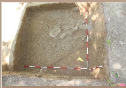
Mohyla 1, južný sektor, úroveň zachytenia hrobovej jamy