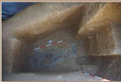
Mohyla 1, zachované zvyšky výdrevy