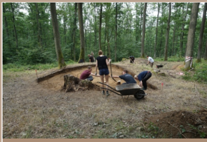
Mohyla 1, začiatok výskumu