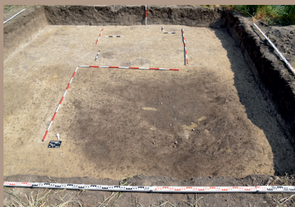
Sídliskové objekty v JV. päťke podporného bodu na úrovni zachytenia