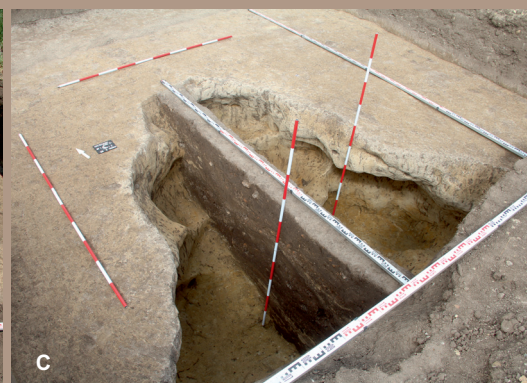
Pohľad na situovanie výkopov podporných bodov stožiaru 1 v bezprostrednej blízkosti rozvodnej stanice (A), sídliskový objekt v JZ. päťke na úrovni zachytenia (B) a po vybratí (C)