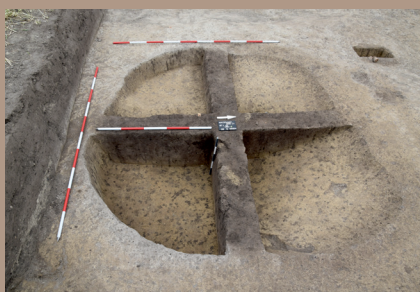
Sídliskový objekt v JV. päťke podporného bodu po vybratí (s KB)