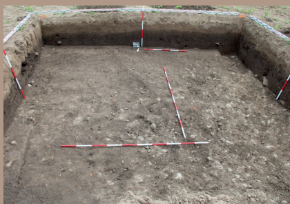
Kultúrna vrstva v SZ. pätke po začistení na úrovni zníženia