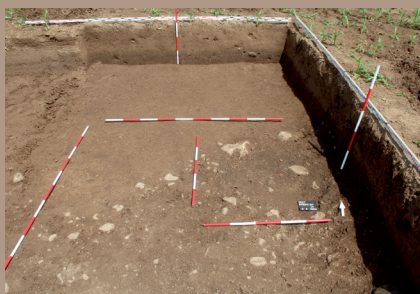
Kultúrna vrstva v JV. pätke po začistení na úrovni zníženia