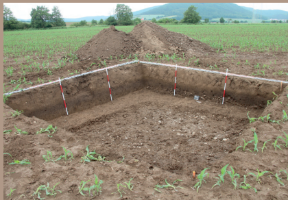
Lokalizácia výkopu JZ. pätky v teréne (pohľad z JV)