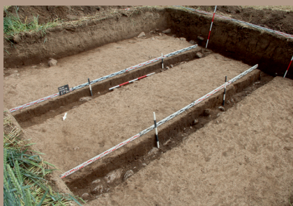
Kultúrna vrstva v JZ. pätke, zistišovacie rezy po úroveň podložja