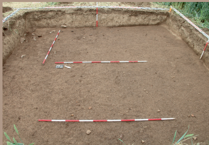
Kultúrna vrstva v JZ. pätke po začistení na úrovni zníženia