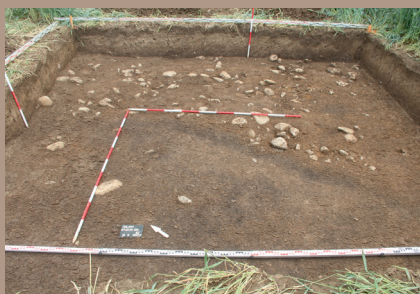
Kultúrna vrstva v SZ. pätke po začistení na úrovni zníženia