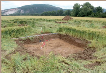
Lokalizácia výkopov pätiiek v teréne (pohľad z JZ)