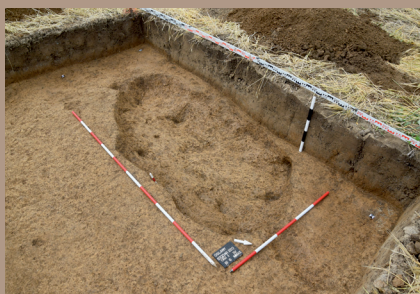
Sídliskový objekt vo V. päťke po vybratí