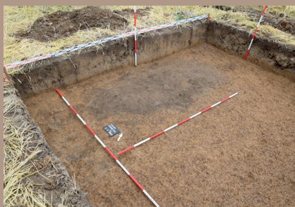
Sídliskový objekt vo V. päťke na úrovni zachytenia