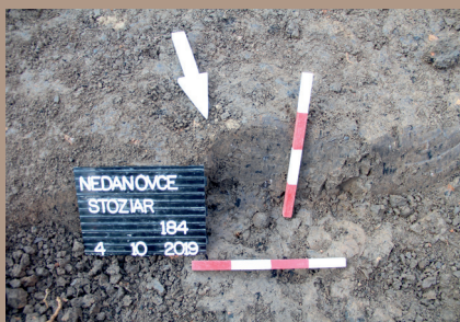
Sídľiskový objekt v SV. pätké počas znižovania - nález prasleny