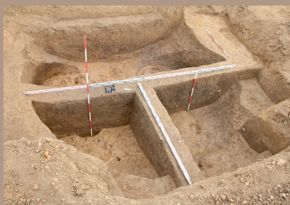
Sídľiskový objekt v SV. pätké po vybratí (s KB)