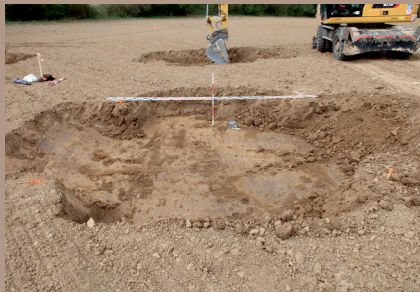
Lokalizácia výkopu SV. pätky v teréne (pohľad z východu)