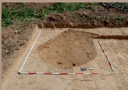
Sídliiskový objekt v SV. pätke po vybratí