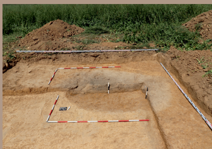
Sídliiskový objekt v SV. pätke počas vyberania