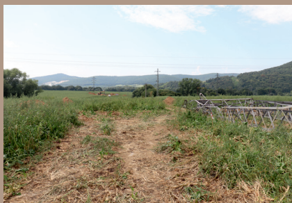
Lokalizácia výkopov pätiiek v teréne (pohľad z východu)