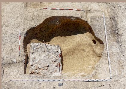
Stredoveký sídliškový objekt porušený základovou pätkou stavby z 19. stor.