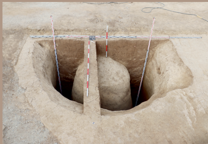
Sídliškova jama so stredovým kužeľom neprekopanej podložnej spráše