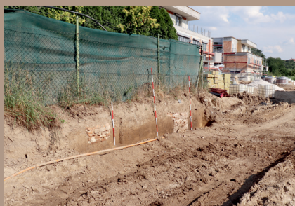
Zvyšky stavby hospodárskej funkcie z 19. stor. v profile príjazdovej cesty