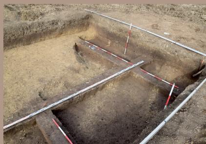
Nálezová situácia v SZ. pätku stožiaru 136 počas vyberania