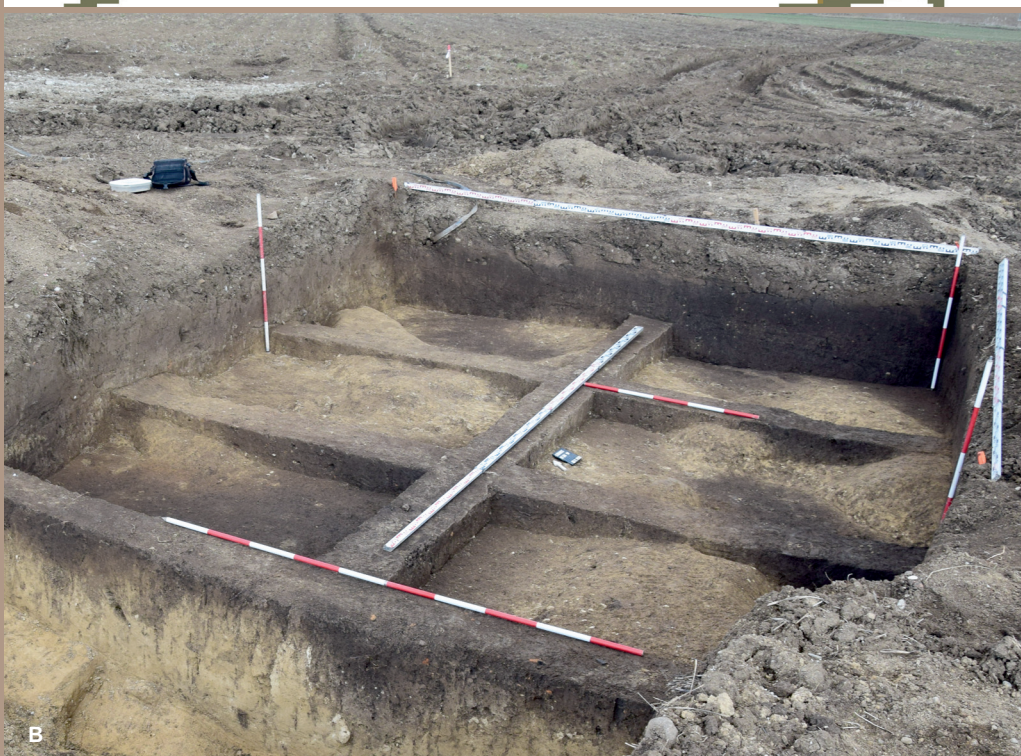
Lokalizácia výkopov pätiiek podporných bodov stožiaru 136 v polohe Pod Vincúrom na ZM 1: 10 000 (A); nálezová situácia v SV. pätku počas vyberania (B)