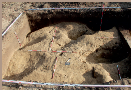
Nálezová situácia v SV. pätku stožiaru 136 po preskúmaní