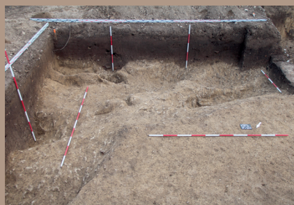
Nálezová situácia v SZ. pätku stožiaru 136 po vybratí