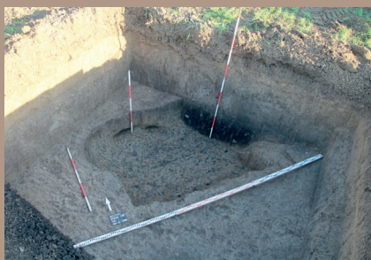
Sídliskový objekt v SV. päťke po preskúmaní