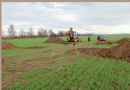
Lokalizácia výkopov pätiiek stožiaru 153 v teréne (pohľad z JZ)