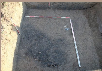
Sídliskový objekt v SV. päťke na úrovni zachytenia