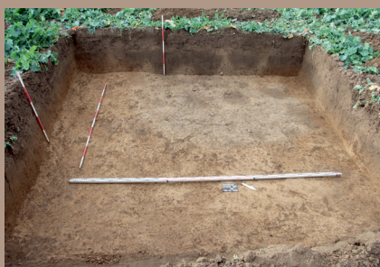
Sídliškový objekt v SV. pätku na úrovni zachytenia