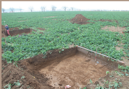
Lokalizácia výkopov pätiiek v teréne (pohľad zo S)