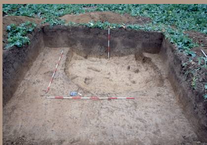
Sídliškový objekt v SV. pätku po vybratí