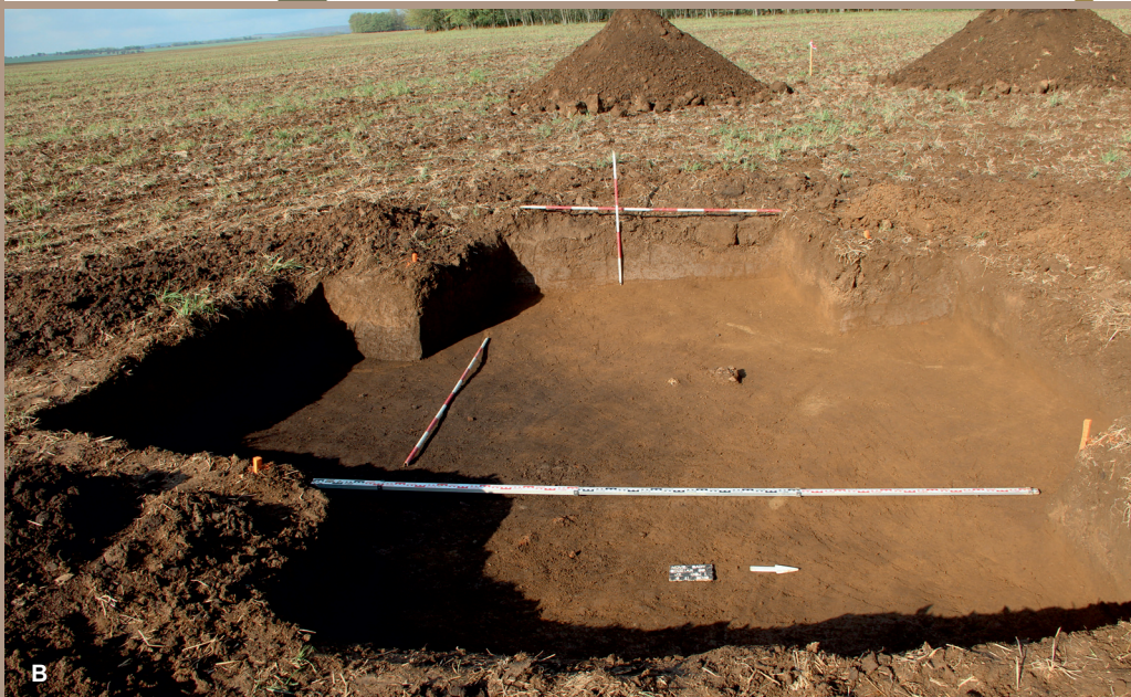
Lokalizácia výkopov pätiek podporných bodov stožiaru 89 v polohe Za potokom na ZM 1: 10 000 (A) a nálezovalá situácia v Z. pätke na úrovni zachytenia (B)