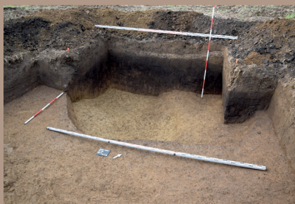
Sídliskový objekt v S. pätke po vybratí