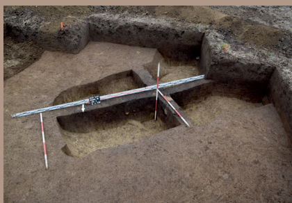
Sídliskový objekt v J. pätke po vybratí (s KB)