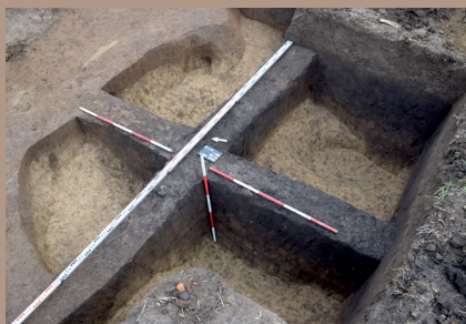
Sídliskový objekt v Z. pätke po vybratí (s KB)