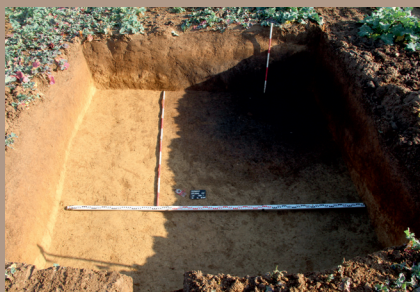
Sídliskový objekt v JV. pätku na úrovni zachytenia