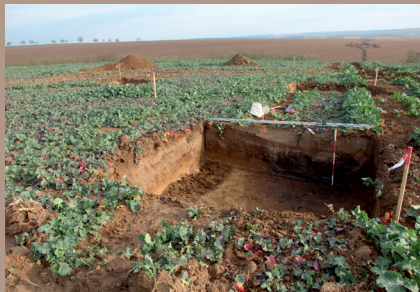
Lokalizácia výkopov pätiiek v teréne (pohľad z juhu)