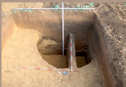
Sídliskový objekt v JV. pätku po vybratí (s KB)