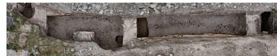
Severná a horná východná terasa. Časť preskúmaných architektúr - murivá M3 a M4 z neskej doby laténskej (hore vľavo a vpravo) a základové murivá barokového Tereziána (dole).