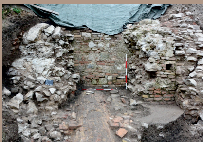
Ústie barokovej chodby s prístavbami