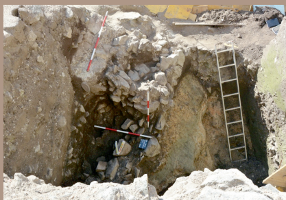
SZ bastión - deštrukcia architektúry (doba laténska)