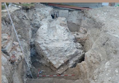
SZ nárožie paláca - zvyšky architektúr z 12.-14. stor.