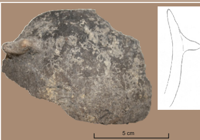
Objekt 1, výber z keramiky