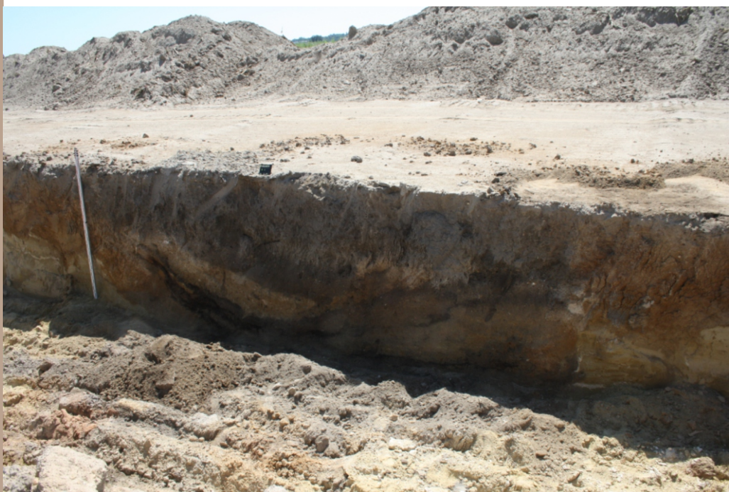
Objekt 1, južný profil