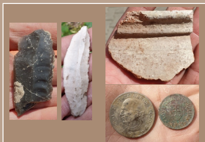
Ukážka štiepaných artefaktov z epipaleolitu, črep zo 16. stor. a mince 1939, 1941