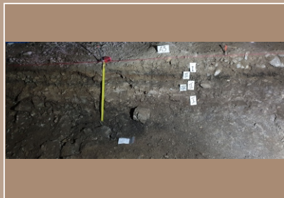
Profil v sonde I/2019 s kultúrnymi vrstvami a ohniskom z epipaleolitu