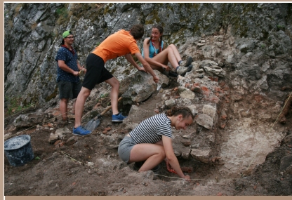
Skautský oddiel z Belgicka pri začisťovaní tretieho nosného piliera vstupného mosta