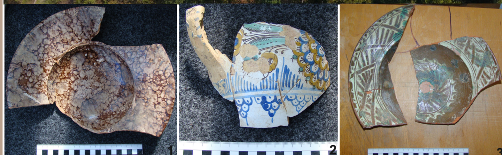
Plavecký hrad - letecký záber. Nálezy keramiky z roku 2017 (obr.1. Novoveký tanier-18. stor., obr. 2 Habánsky džbán-17.stor.,obr.3 Novoveký tanier 17.stor.)