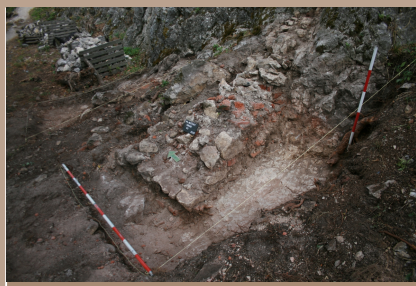
Plavecký hrad, sonda 1 zvyšky tretieho nosného piliera vstupného mosta