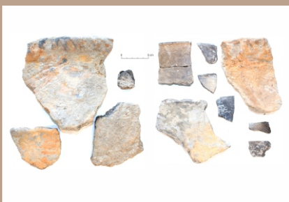
Výber nálezov z objektu 2