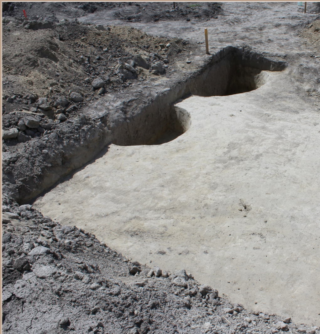
Preskúmané časti objektov 1 a 2