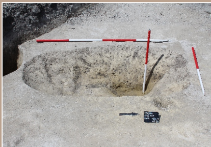
Objekt 4 po preskúmaní