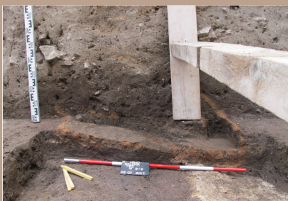
Chlebová pec zahĺbená do splanírovaného včasnouhorskeho valu.