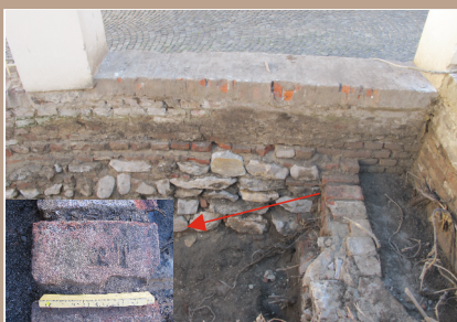
Pôvodný vstup do záhrady Župného domu zo Samovej ulice so signovanou tehľou.