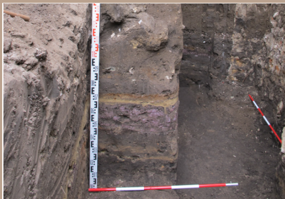
Pohľad na spodné vrstvy valu a vrstvy z doby bronzovej.