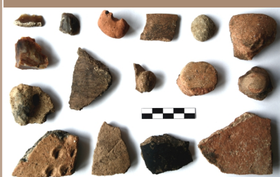
Praveký materiál z lokality Šariny.