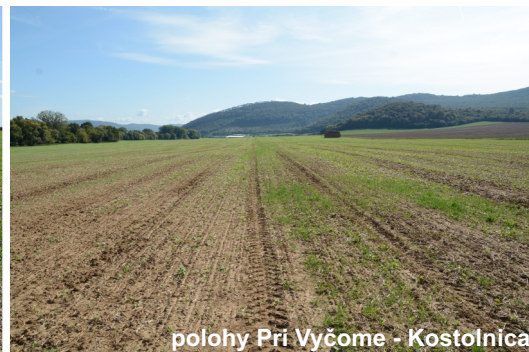
polohy Pri Vyčome - Kostolnica