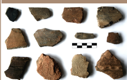
Keramika polykultúrneho charakteru z lokality Kostolnica.