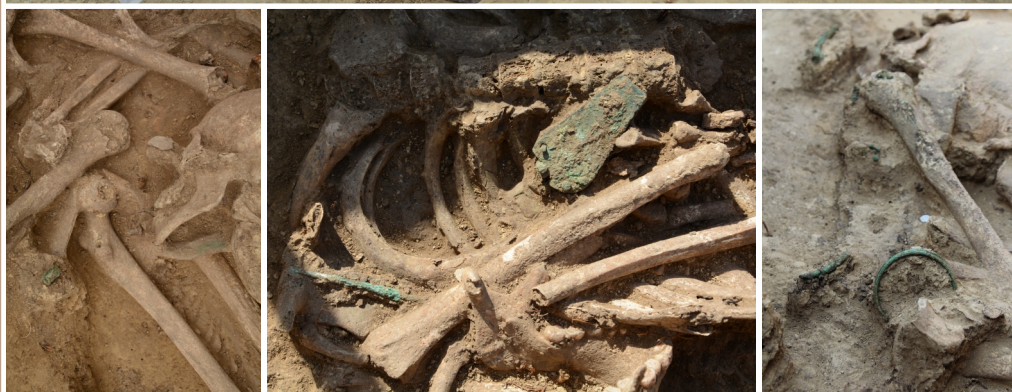
Odkryvanie hrobu zo staršej doby bronzovej; ukážky medenej industrie v hrobch.