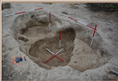
Objekt z doby popolnicových polí.