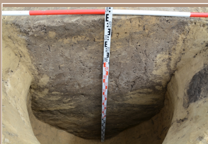
Profil novovekej jamy.