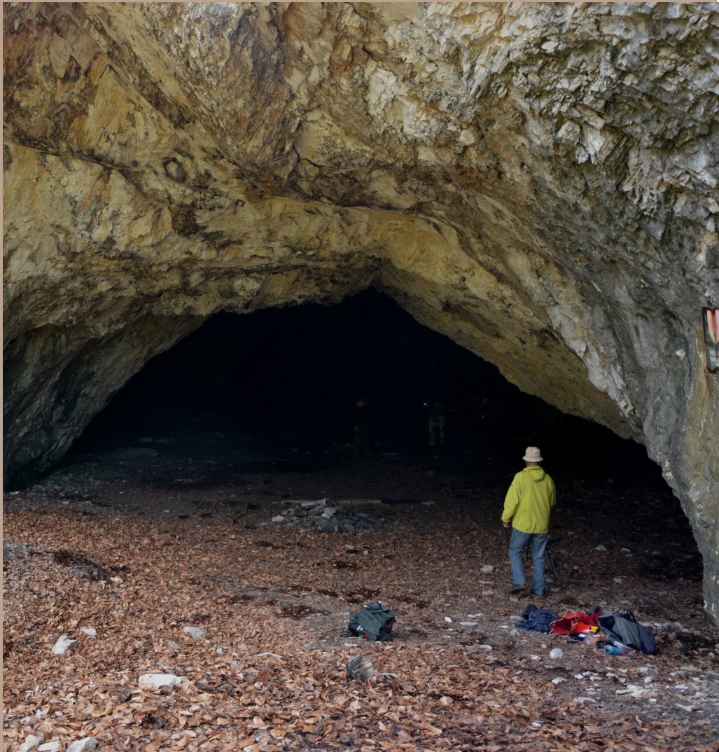
Veľká Ružínska jaskyňa