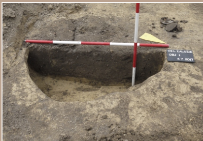
Objekt 1 - profil JZ-SV