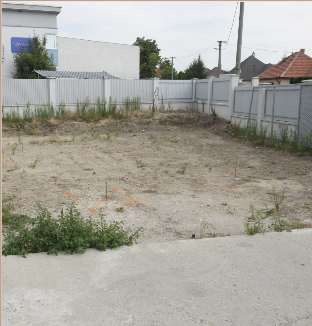
Veľké Zálužie. Skúmaná plocha