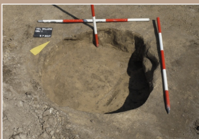
Objekt 1 po preskúmaní