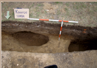
Kovarce, kostol sv. Mikuláša, sonda 10G, novoveké sídliskové objekty