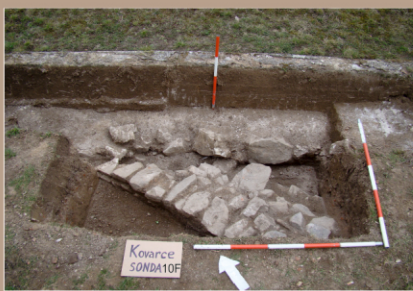
Kovarce, kostol sv. Mikuláša, sonda 10F, ohradový múr narušený výkopom dažďovej kanalizácie v roku 1978.