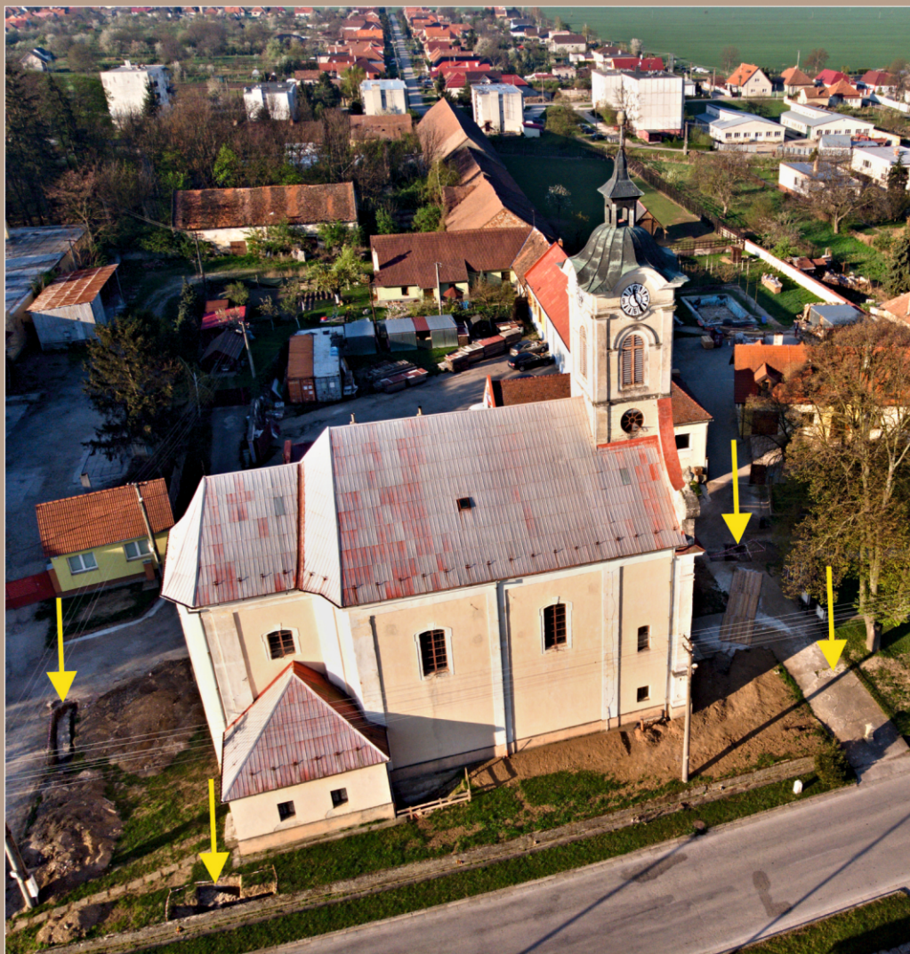
Kostol sv. Mikuláša v Kovarciach sondy archeologického výskumu v roku 2019.