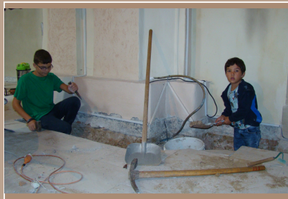
Kovarce - archeologický výskum v barokovom presbyteriu kostola, šírka ryhy 40 cm, hĺbka do 50cm