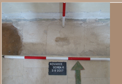
Kovarce severná stena barokového kostola s maltovými otlačkami pôvodnej kamennej dlažby (40x40cm)