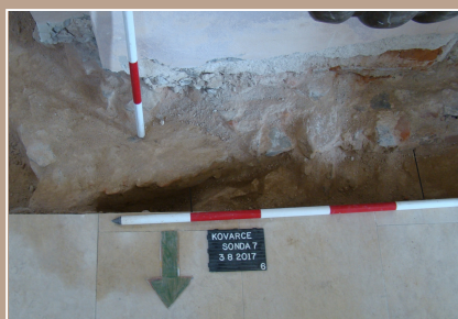
Kovarce JZ roh barokového kostola - sv. Mikuláša s výškmenými základmi pôvodného gotického kostola