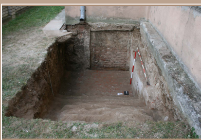
Sonda 3, vstup do krypty A. Welsa pod severnou sakristiou