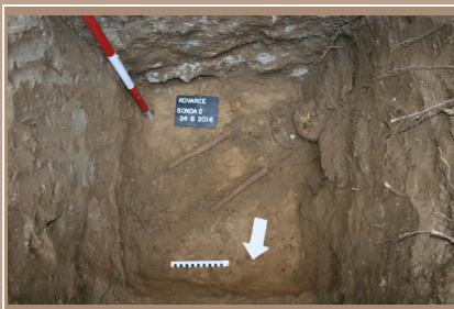
Sonda 2, stredoveký hrob pri severnom múre kostola sv. Mikuláša