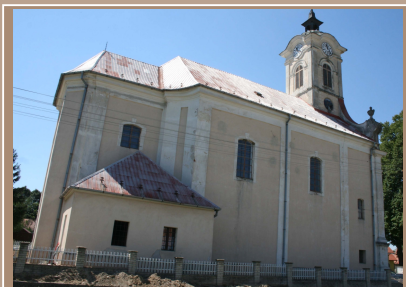
Pohľad na barokový kostol sv. Mikuláša zo severovýchodu