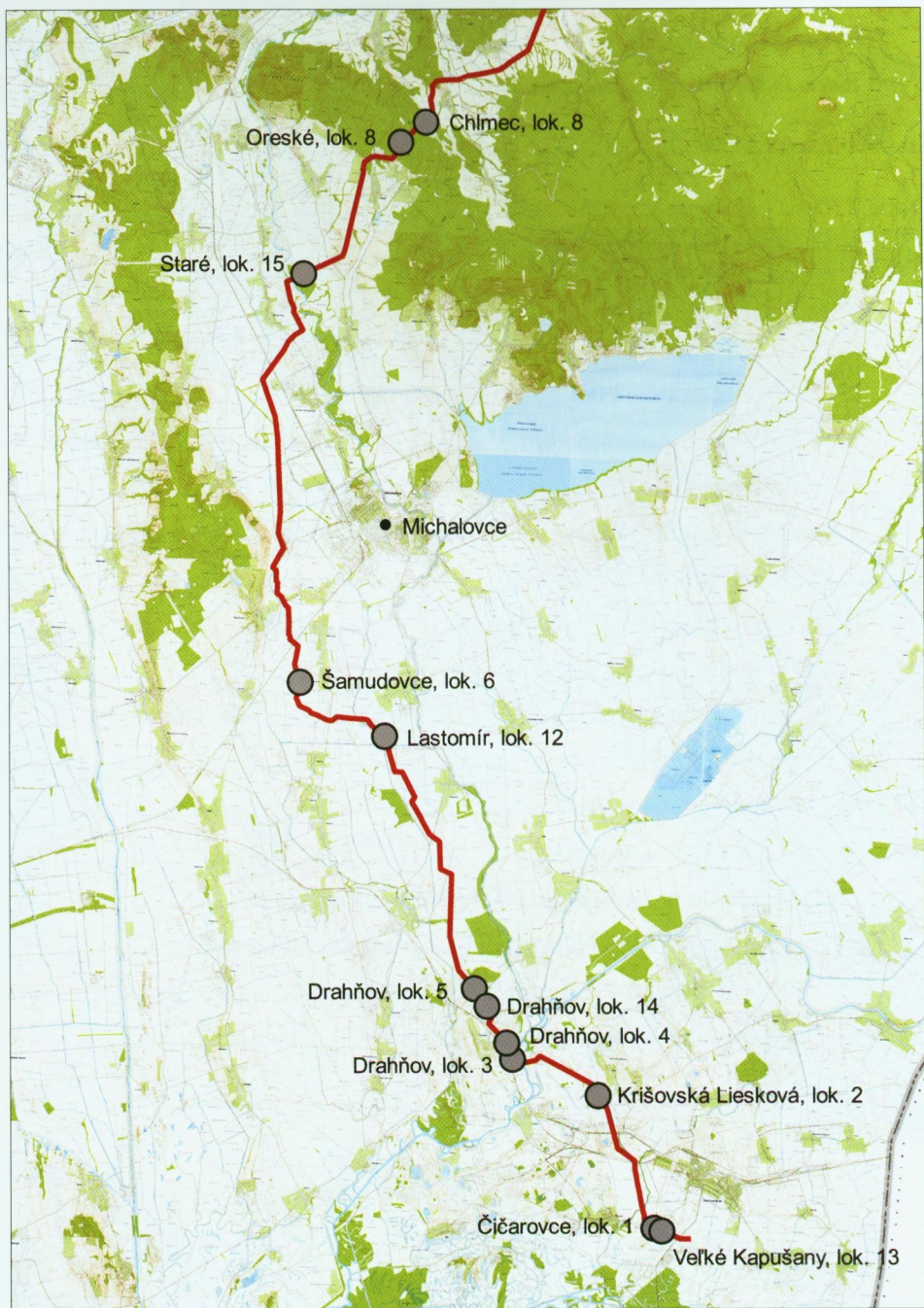
Obr. 2. Trasa tranzitného plynovodu. Južný úsek od Veľkých Kapušian po Chlmec s vyznačením zdokumentovaných archeologických lokalít.