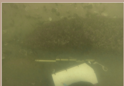
Kresbová a fotografická dokumentácia