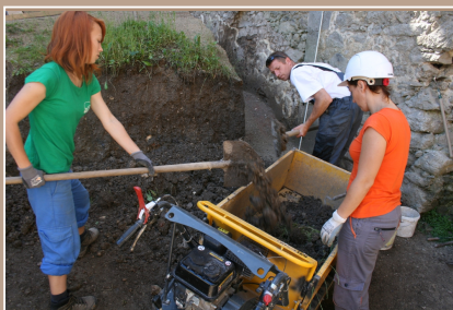
Sonda 17 nádvorie stredného hradu (pracovný záber z výskumu)