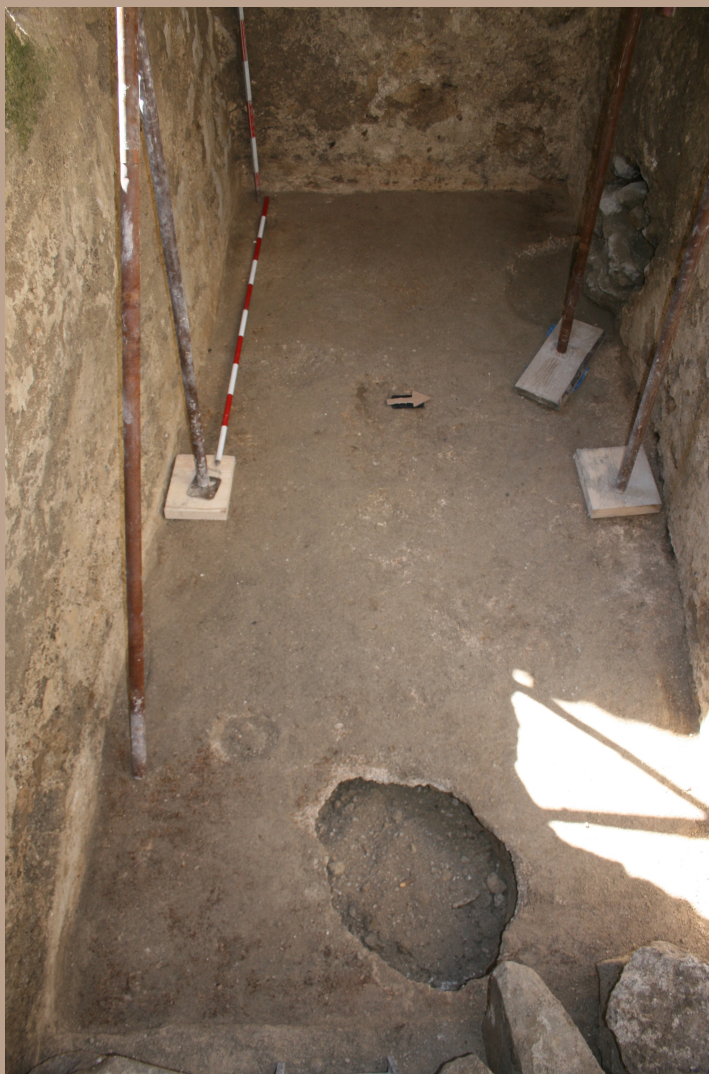
Sonda 23 Pozdĺžna bašta so zachovanou bielou maltovou podlahou