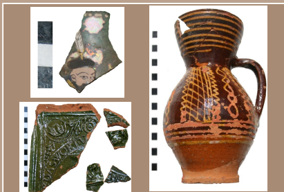
Výber nálezov zo sondy 17