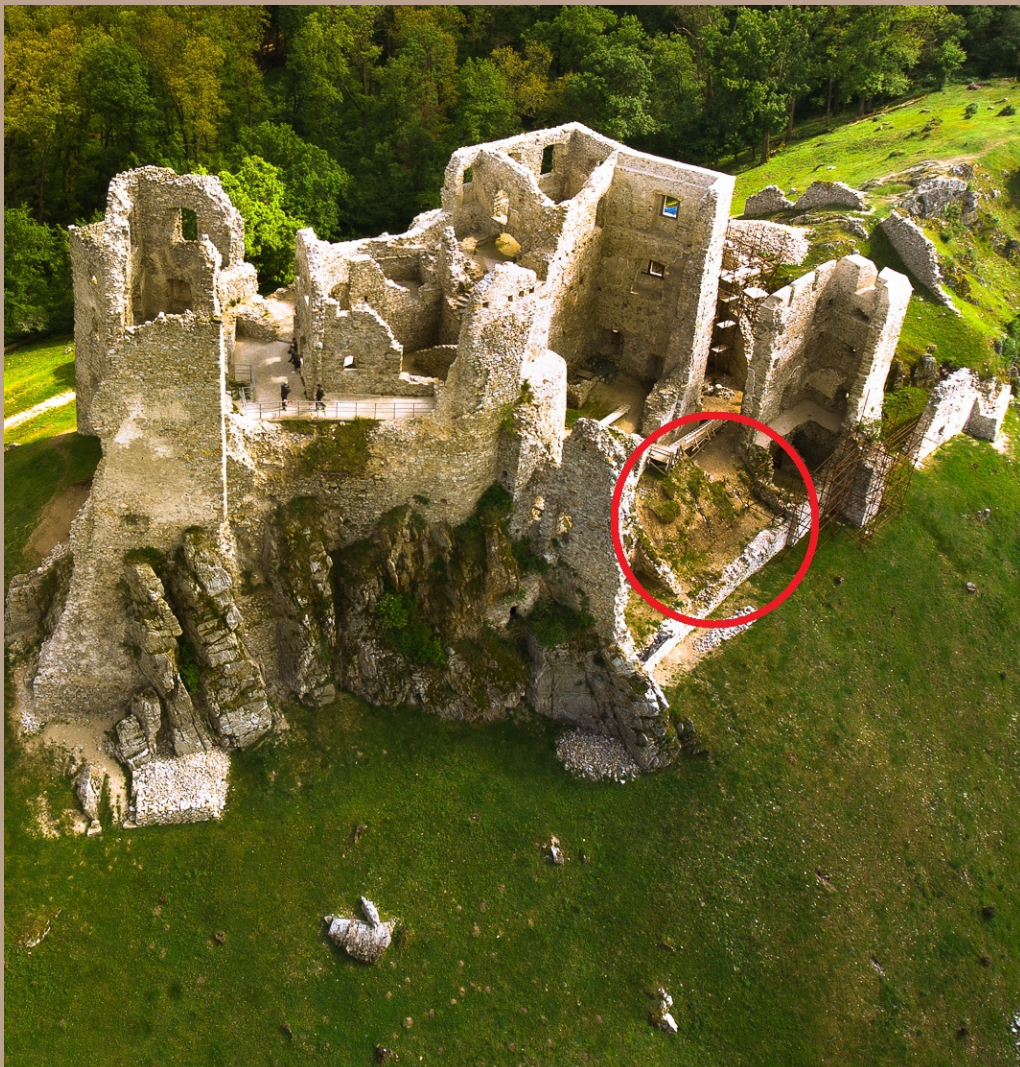
Hrad Hrušov. Archeologický výskum západného nádvorja.