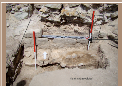
Hrad Hrušov, sonda 2/2018, zachytený kamenný prah a základy hospodárskej budovy v severnej časti západného nádvorja.