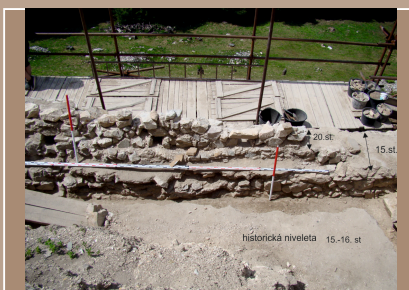
Hrad Hrušov, sonda 3/2018, odkrytá západná hradba a historická niveleta v 15. storočí. Zachytená aj rekonštrukcia z 20 rokov 20. storočia