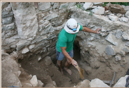
Začist'ovanie sond 15F v priestore druhej renesančnej brány.