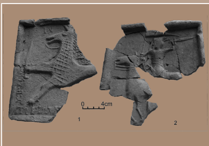
Neskorogotické komorovité kachlice