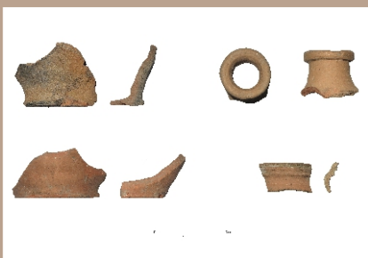
Nálezy keramiky zo základov stavby