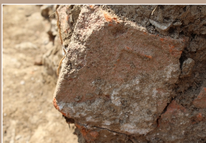
Zlomok kolkovanej tehly zo základov