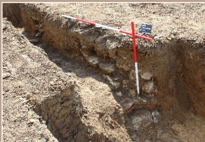
Porušené základové murivo