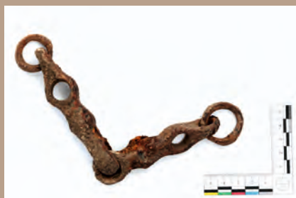
Veľkomoravské zubadlo z deštrukcie brány