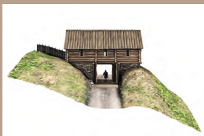
Ideálna rekonštrukcia brány