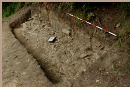
Sonda vo svahu nad bránou