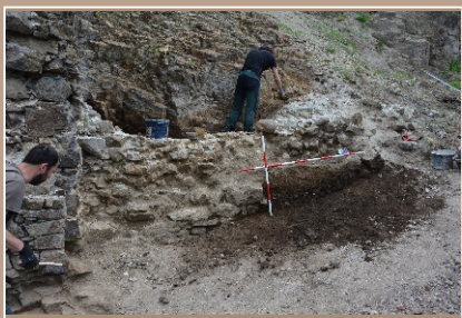
Výskum východného múru bránovej budovy