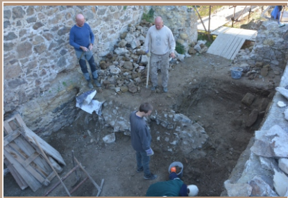
Brigáda na hrade