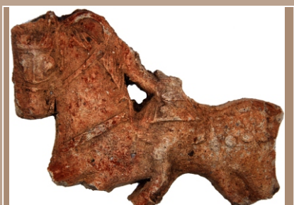
Kachlica s vyobrazením jazdca na koni objavená v zásype južného paláca