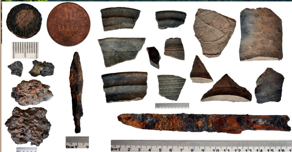
Hrad Teplica (Pustý hrad) pohľad a výber archeologických nálezov