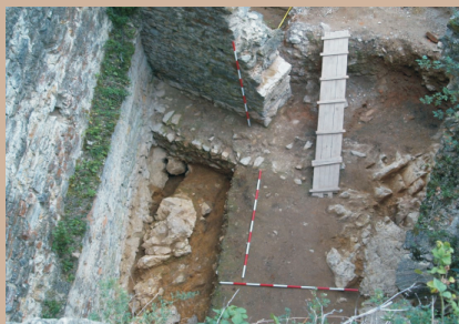
Južný palác - pivnica 3b (14. storočie), sonda 3b1 a základ staršej stavby