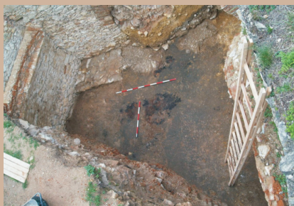
Južný palác - pivnica 3c (14. storočie), základ staršej stavby