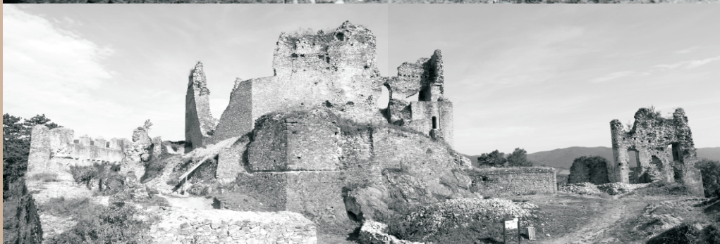
Hrad - Divín - hore 1974 (G. Krúdy), dole 2012 (E. Fottová)