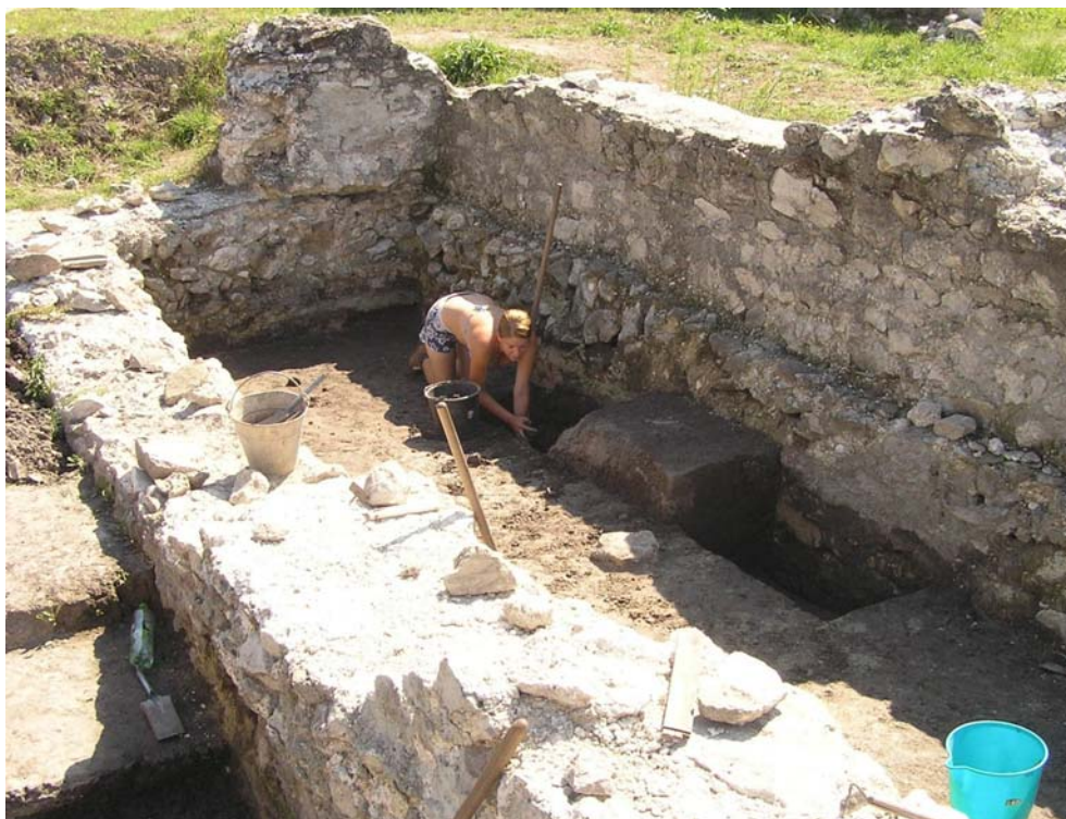
Obr. 4. Základy zvýšenej podlahy z nepálených tehál v juhovýchodnej časti kúpeľov.