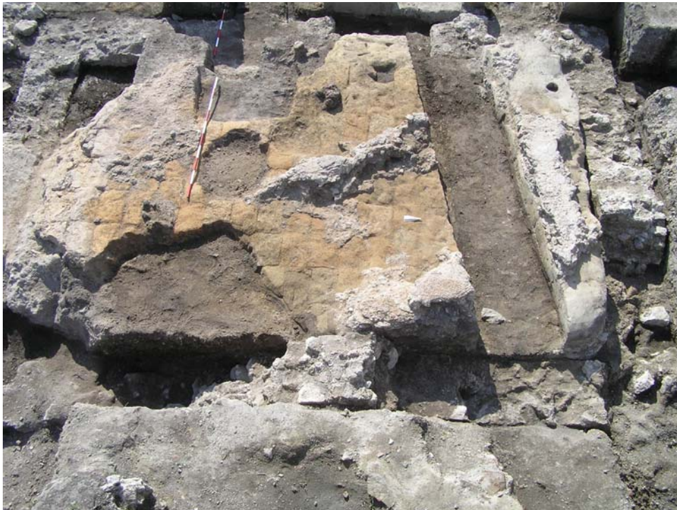
Obr. 6. Vrstva rozlámanej strešnej krytiny.