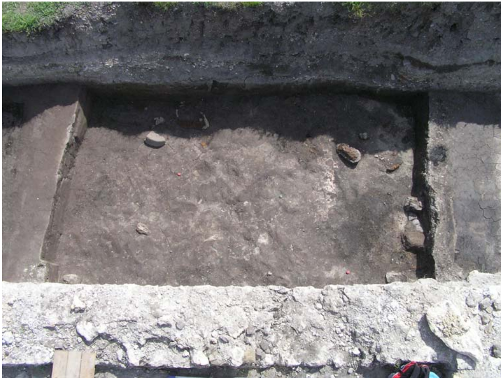
Obr. 10. Stopa podrážky z vojenského sandála.