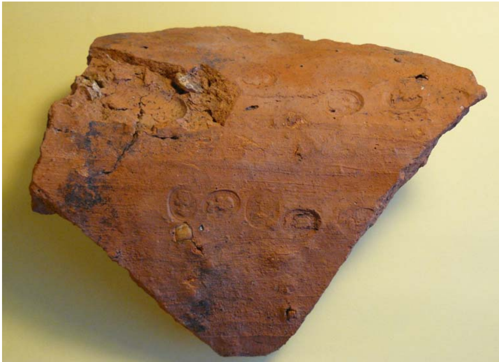
Obr. 8. Odtlačok gemy pečatného prsteňa so ženským portrétom.