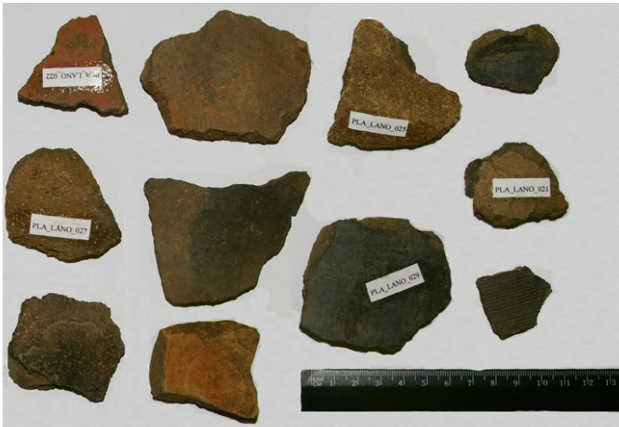
Obr. 03. Plášťovce, Lanovisko; výber nálezov.