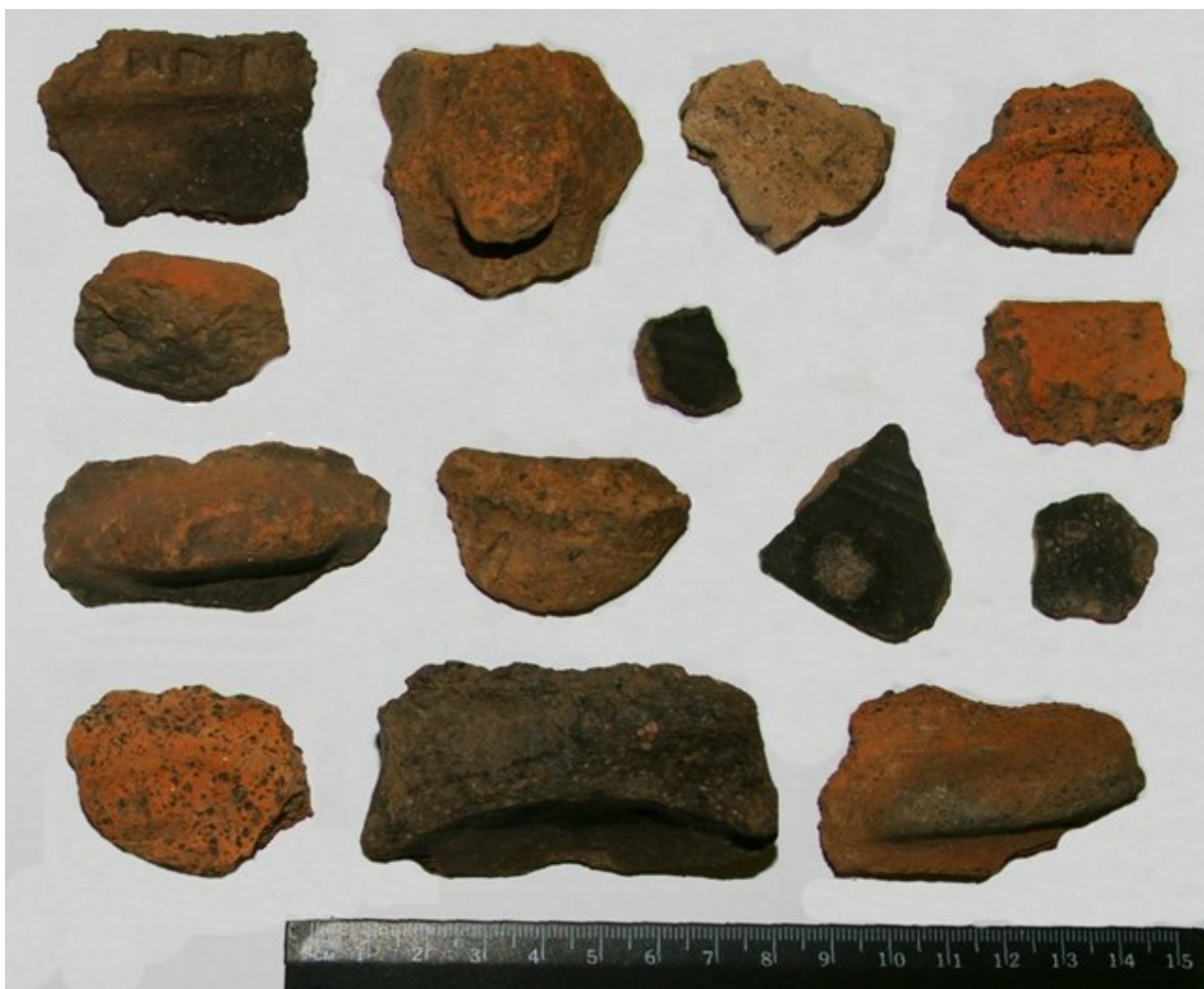
Obr. 02. Lišov, Senné; výber nálezov.