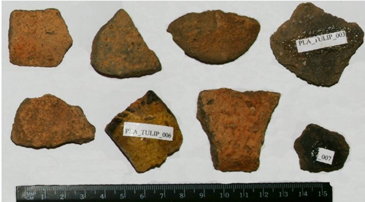
Obr. 04. Plášťovce, Tulipánka; výber nálezov.